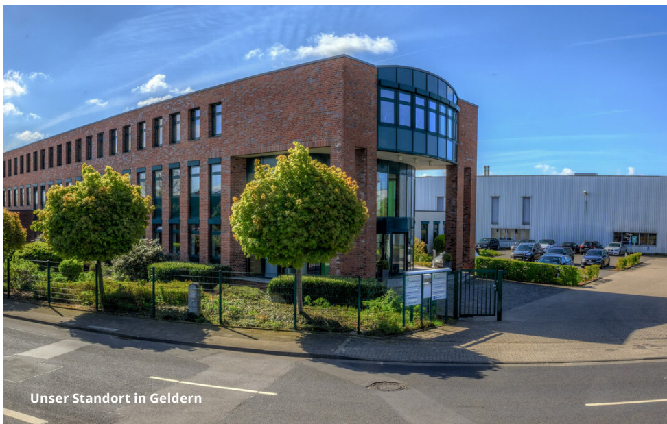
Unser Standort in Geldern

Menschen und Lebewesen auf unserem Planeten verpflichtet. Was in unserer Verantwortung steht, sollte auch getan werden, damit die Nachkommen eine möglichst intakte Umwelt und ein funktionierendes Ökosystem wiederfinden können.